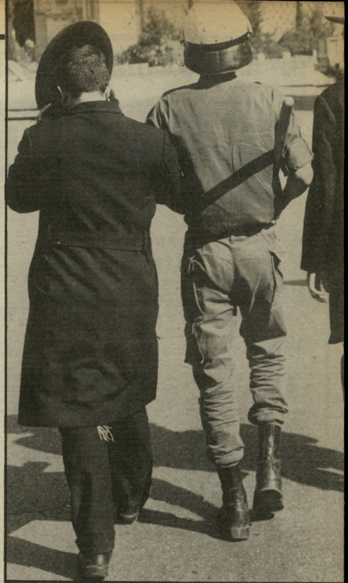
חרדים עצורים בירושלים כל העצורים שוחררו

העלול להרגיו קנאים דתיים. זהו חומייניזם באיצטלה חוקית ודמורקרטית. המסקנה המעשית השניה: עוד באותו יום, לפני החג, שוחררו בכל רחבי הארץ הבריזנים הרתיים שהציתו תחנות, פגעו בשוטרים והפכו בפרהסיה את החוק לחוכא ואיטלולא.