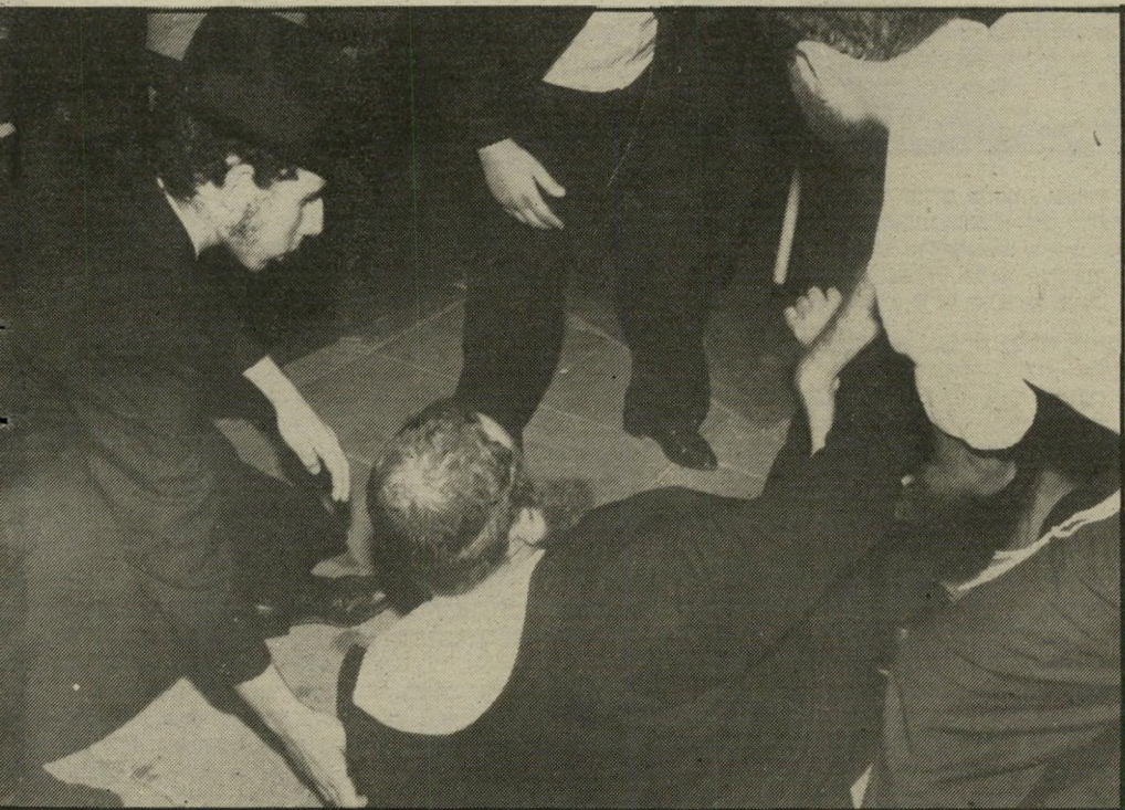
הרב סלומון על הארץ בפתחתיקווה החקירה קבעה: הוא מעד

מבחינת שימעון פרס היה זה רק המשך של קו עיקבי. פרס, שעבר כשחר נעוריו בפולין שלב דתי קיצוני, בהשפעת סבו החרדי, האמין תמיד שיש לפייס את הרתיים. מעשהו הראשון כראש-הממשלה היה ללכת לכותל המערבי ולתחוב פתק בין אבניו, כדרכם של עוברי-איליים.