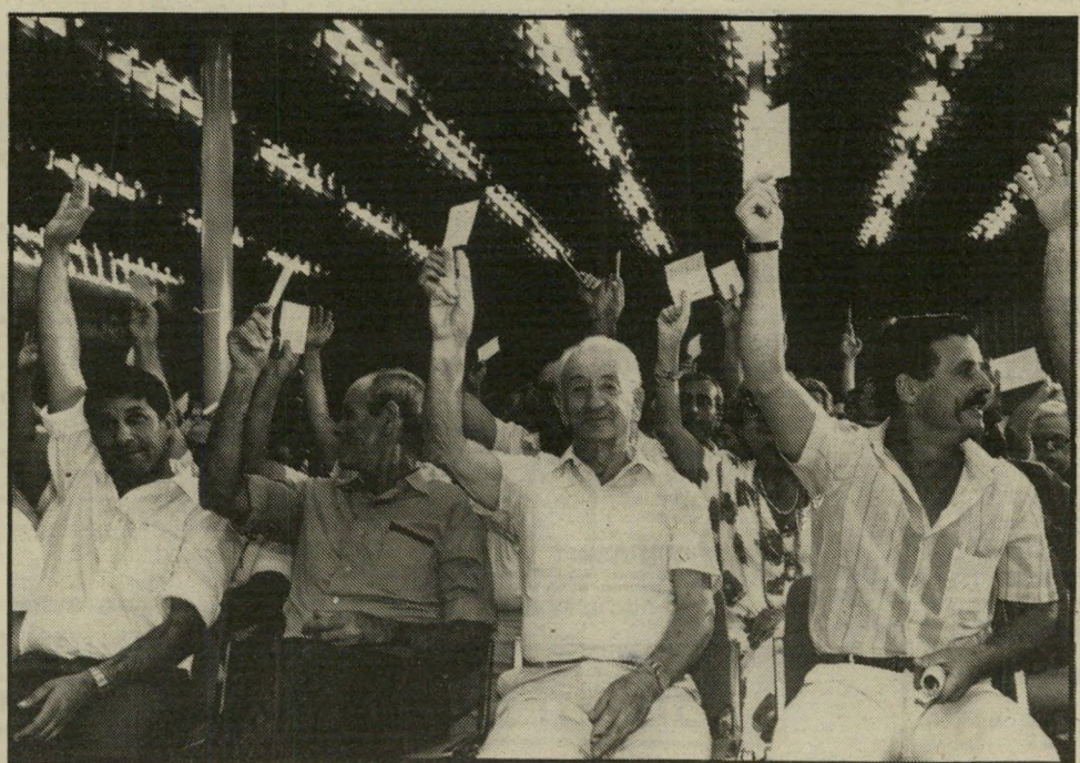
ההצבעה במרכז מוסלתיהעבודה כמו בסובייט העליון

בעיני הציבור האמריקאי, זהו מה שקרה. פולארד היה אישיביון. הוא הפך לבוגד. זהו חטא שלא יסולח. תובע ממולה. ברור כיום כי ממשלת ישראל ניסתה לפתור את הכעיה באמצעות תעלול. היא הדיחה, כביכול, את רפי איתן, שעליו הוטלה