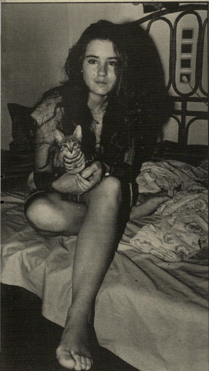
לימור עם התולת האה, לא תבוא אחרת במקומה...

בגליון האחרון פירסם העולם הזה סקופ: שרישומי הקופסה השחורה של רכבת-המוטות פוענחו, והוכיחו כי הרכבת לא כלמה כלל. הגליון הופיע ברחובות תל-אביב ביום השלישי לפנות-ערב. במהדורות החדשות של חצות באותו היום שידרה הטלוויזיה ידיעה זו — בלי לצייין שהעולם הזה פירסם אותה. הידיעה באה לטלוויזיה מי תל-אביב, מידי הכתב רוני סביד. מסתבר שהוא לא לקח את הידיעה מהעולם הזה, אלא שהיא הגיעה אליו ממקורות אחרים. סמיכות-הזמנים הי' מוזרה היתה באמת מיקרית לגמרי. למחרת היום, ביום הרביעי, הביאו כל שלושת הצהרונים את הידיעה. מעריב וחדשות פירסמו אותה בעמודים הראשונים, ידיעות אחרונות בעמוד 12. אף אחד משלושת הצהרונים נים לא ציינו כי הידיעה פורסמה יום לפני כן בגליון העולם הזה. מעריב הסתמך על הטלוויזיה, האחרים לא ציינו שום מקור.