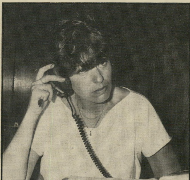
המקליטה במקום גבר