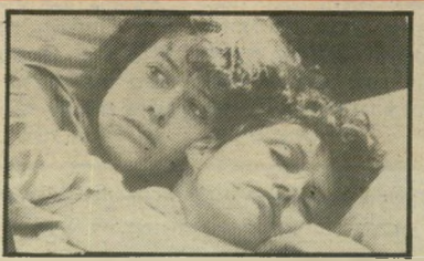
לואיז מארלו: לסביות נואשת

לאה פול, צילמה את תחילת הסרט וסופו בישראל, אם כי לא ברור למה. (קנדה).