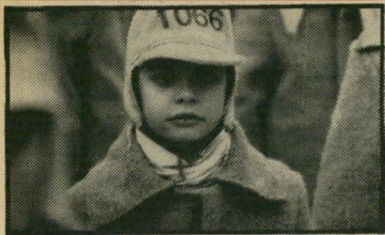
בדרך להשמדה: ילדי ג'יהעדן

קודם לכן תסריטים (כמו התוודעות) לבימאי אשטון סאבו. (גרמניה-הונגריה).