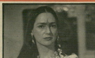
אופליה מדינה: דמיון מדהים

בין יצירותיה, המוצגות בהרחבה, לח- ויות החיים האמיתיים שלה. (מכסיקו).