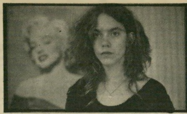
אנה לינדן: גיהינום עלי אדמות

לתהום ערכית. הבימאי הוא בן הדור הצעיר בשוודיה, קאי פולאק. (שוודיה).