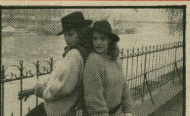
גולות בפאריס: מרהיב-עין

ומרהיב-עין, עם מוסיקה נהדרת של המוסיקאי אסטור פיאצולה. (צרפת).