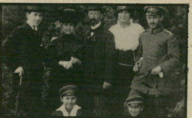
מישפחה יקית: אהבה לגרמניה

גרמניה תפשו היטב את המשמעות הנוראה של השואה. (ארצות הברית).