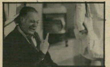
מארצ'לו מאסטרויאני: חיסול חשבונות

הגונב את ההצגה הוא, כמוכן, פלניי האנדתי עצמו. שאין שני לו. (איטליה).