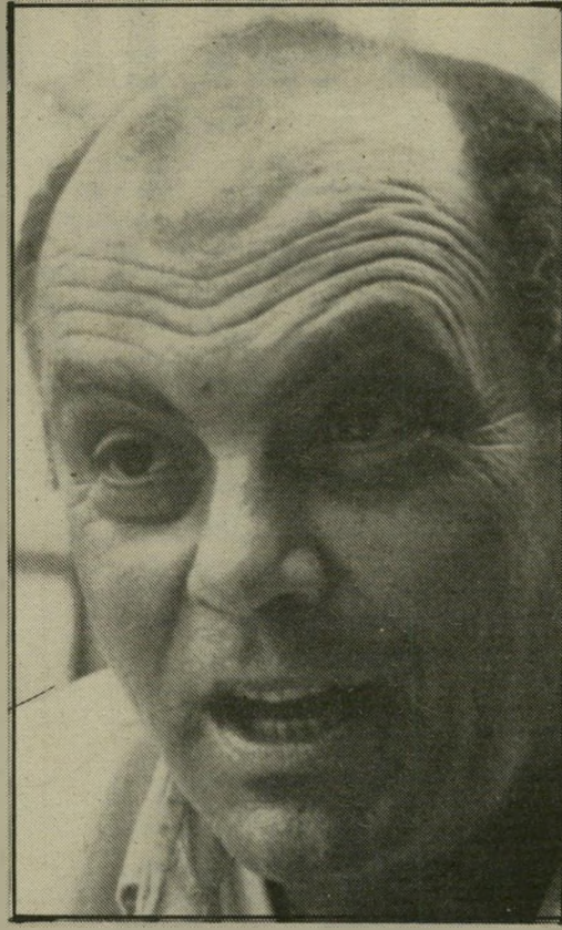
הפרופסור דניאל גור:

הוכח שבנסיעה איטית, התגורה אפילו יותר אפקטיבית. חוץ מזה אין צורך בהשקעה כספית נוספת לשם כך, ויש במילא מערכת הסברתית מצוינת לשימוש בחגורות-בטיחות בכלל. מדובר כאן בחיי-אדם!