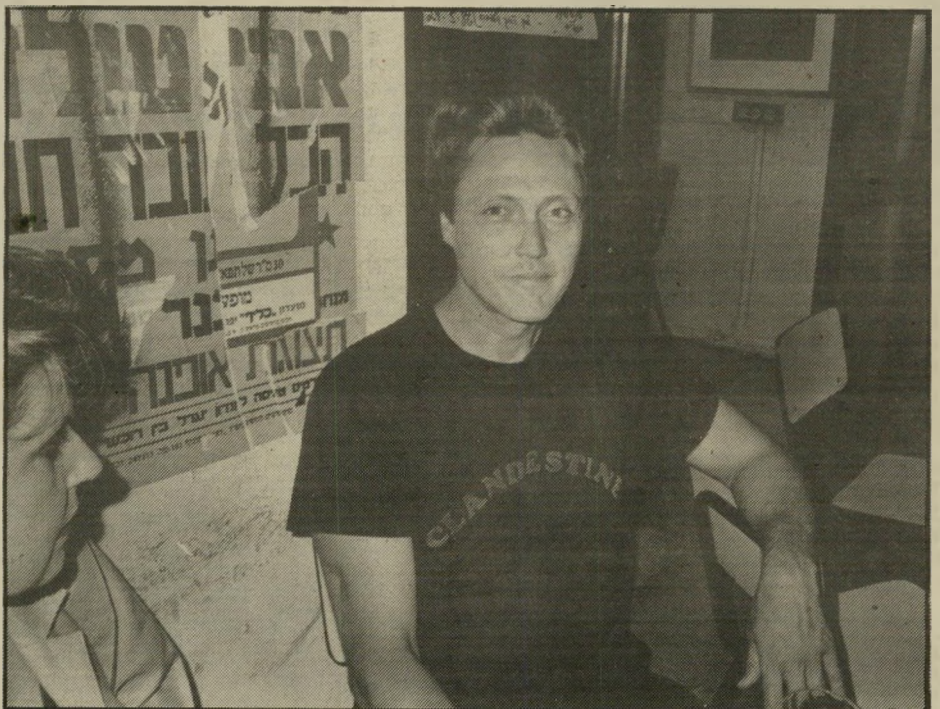
כריסטופר ווקן השחקן שרכש לו שם בסרט צייד הצבאים, עתיר-הפרסים, שוהה עתה בארץ לרגל הסרטת סרט של מנחם גולן. הסרט נקרא תחילה סקופ, אך במהלך ההקרנה שונה השם. כשהתברר למפיקים כי יש ספר בשם סקופ שכתב הסופר הבריטי אוולין וו על עיתונאי בריטי כושל במלחמת אתיופיה. לסרט ניתן שם חדש: איזור קרבות. הוא מספר על עיתונאי המסקר את מילחמת-הלבנון, ומשעורבותו מעמיקה ולבסוף הוא נוטה לצד הפלסטיני. לצידו של השחקן ווקן: אשתו.