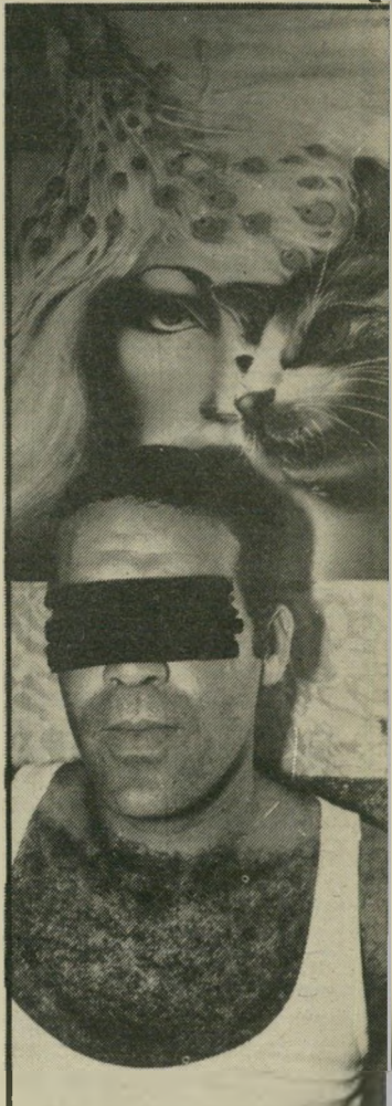
חתול ונימפה על פוסטר ב' חדרו של ר"א בן ה-28. היושב בכלא על עבירות מירמה.

מרחוק הם נראו כקבוצת נופשים שהתקבצה על הרשא, כדי לחזות בהופעה של להקת משינה: ביגדי-ספורט חדישים, מישקפי-שמש ותיסרוקת רטובה עדיין מהמיקלחת. בין הצופים הסתובבו נערות נאות, ילדים, וכמה כלבלבים. על הבימה קיפצו חברי משינה. אבל נראה היה שאת הנופשים