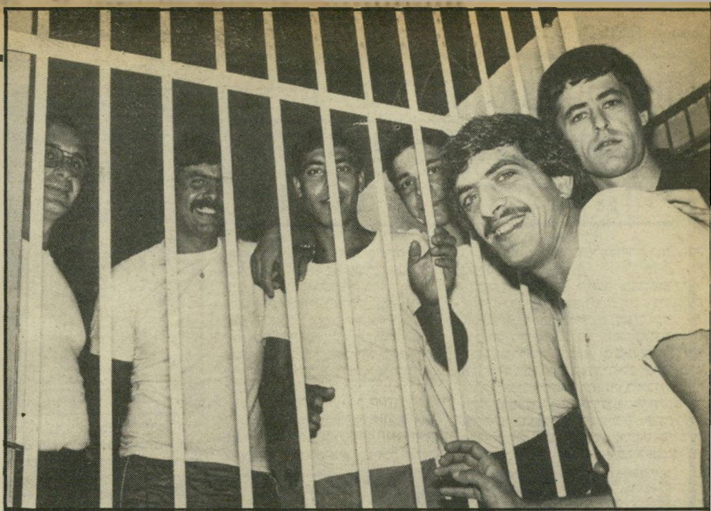
משום-מה, רק בביתן שבו נמצאים הסיפריה וחדרי-התחביבים, רוב האסירים הכלואים בכלא אשמורת שפוטים על עבירות קלות וזו להם מעידתם הראשונה.

האגף מוקף בגדר דלילה ונמוכה. שאפילו ילד יכול לדלג מעליה. לאגף השלישי לא הניחו לעיתר נאים להיכנס. אגף זה מכונה כפי ה-