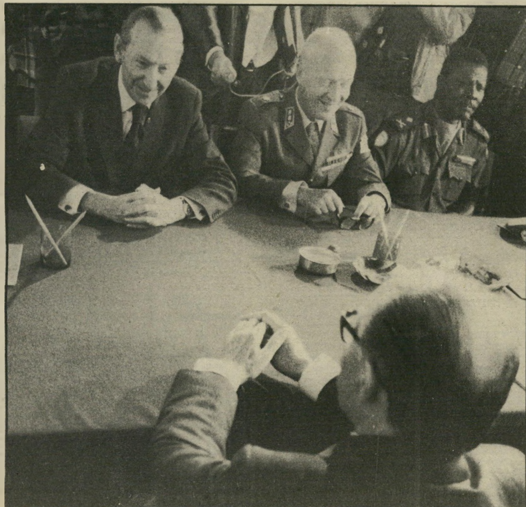
קורט ולדהיים (עם קציני האו"ם) מול מנחם בגין (שלומיאלים כרגיל)

6 הפרשות נעלמו. ולדהיים עשה את שלו. היהודים עזרו לו להיבחר, אך גם הוא עשה להם טובה.