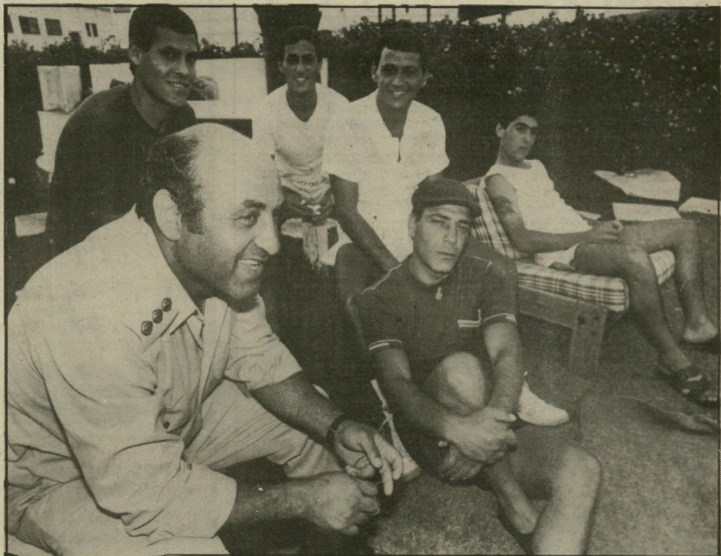
הסוהרים חייבים ללבוש מדים. האסירים לובשים את ביגדיהם הפרטיים. פעם בשבוע לוקח סגן-המנהל בקבוצת אסירים לשחייה בבריכה של קיבוץ סמוך.

של הרכיכלאי הקשוח הוא, שדאג עם כואו לכנות חלונות בצנינוק, שעד אז היה ללא חלונות, אלא עם אשנבי איורור בלבד. למרות האווירה הפסטוראלית, הר-גיש גבאי כי אסור לשכוח שעם כל היות המוסד כלא ליבראלי ופתוח יוד-סית, כלואים בו גם כאלה שהורשעו בעבירות כמו הריגה, אבל הרוב נקלעו לבית-הסוהר כשל תקיפה, התפרצויות ומירמה.