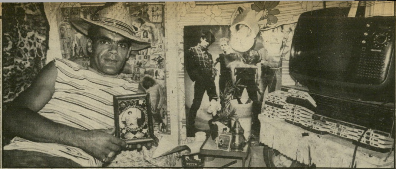
ותמונות רבות המעידות על טעם משובה. אלמונסו. גבר קשוח המתהדר בכובע עם נוצה, טוען שצריך להיות משוגע כדי להפר את המישימעת בכלא הנוח. אז עפים לכלא איילון ברמלה או למעשיהו, הנוחים פחות.

בשמירה עליו, 24 שעות ביממה, עסקו בני-מישפחתו. גירסה אחת