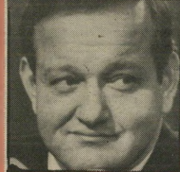
שילון — ואפטרישיב