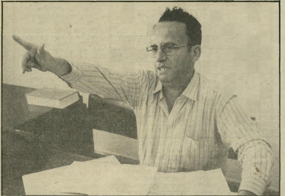
מנהל בית הספר שפרן מדוע הופסקו ריקודי בנים בבנות בתנועת הנוער הדתית?

אלימות, כי זה תמיד משיג את התוצאה הפוכה.