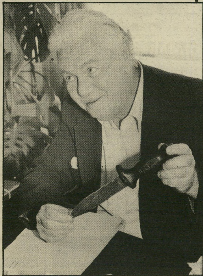
תובע שרטר והסכין כוכב־הטלה