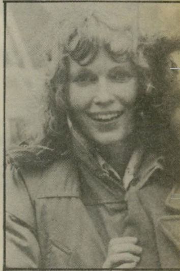
מילא פארו ב.הנה ואחיותיה מחוץ לתחרות הרישמית