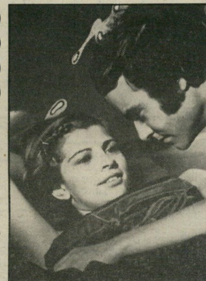
יעוד לבנון (עם עיריית שלג) - לכל בימאי הקולנוע!

לא תאמינו! הוא החליט שמה שהוא רוצה לעשות בחיים שלו זה לחזור ארצה. קם ועשה. עכשיו הוא כאן. כבר הספיק לשכור לעצמו דירה במיגדל-ידויד בתל-אביב, בקומה ה-12, ולוועד כמה זרעים לעסקים על אדמת הקודש. הוא רק חוזר לניוירוק לחסל שם את