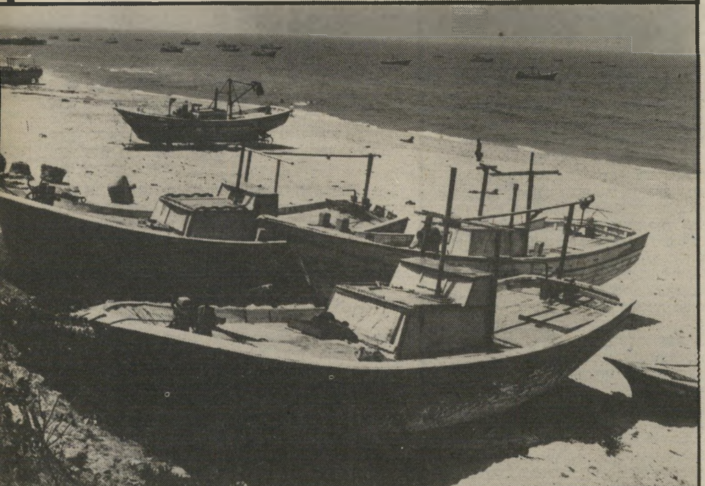
בהסגר נמצאות הסירות המוטלות על החוף. ללא טיפול בהוראת בית-המישפט הצבאי, כאן מכנים אותן „סירות בכלא“. גורלן טוב מגורל הספינה שאנשיה נעצרו ליד ח'יינס והיא ננטשה על החוף. חניה במים. אחרי יממה אחת התנפצה ממכות גלי-הים ולא ניתן לשקמה עוד.