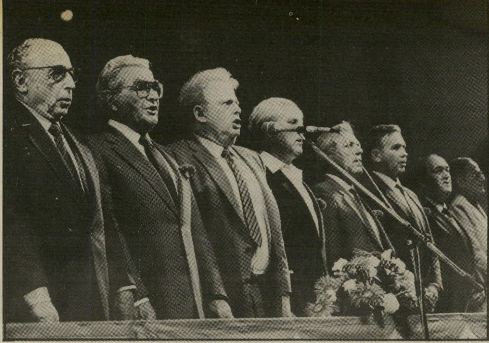
בימת-הנשיאות בוועידת המרכז הליברלי קצת צפוף בצמרת

פעמים רבות הוהרו העסקנים הדי: לא כדאי לכם לפגוע בסטאטוס קוו. אם ישנתה בכיוון אחד, הוא עשוי להשתנות גם לכיוון השני. במשך השנים התרגלו העסקנים הדתיים לשינוי החד-סטרי. הכפיה הדתית גברה. כל "הישג" הובטח באמצעות "סטאטוס-קוו" חדש, ולמחרת היום יצאו להשיג הישג נוסף. עכשיו מתברר כי היתה זאת טעות. הסטאטוס קוו משתנה לכיוון ההפוך. קולנוע ודרגל. הנהגת שעון הקיץ בישראל השבוע היוותה תבוסה לעסקנים הדתיים. הם התנגדו לכך, אך ההתמרדות הפעילה של דעת-הקהל — הראשונה מסוגה בתולדות המדינה — הכריחה אותם להיכנע חלקית. הם צימצמו את תקופת שעון-הקיץ. אך לא יכלו למנוע את הנהגתו כליל. עכשיו באה הצגת סירטי-הקולנוע בערב-שבת בחיפה. אחי פריצתה הדרך כפתח-תיקוה, מתפשט נוהג זה ברחבי הארץ. כעוד שרב אשכנזי שוחרי-פירסומת גורם למהומות בלתי-פוסקות כפתח-תיקוה, החליטו רבני חיפה שלא כדאי להתגרות בציבור החילוני. הציבור הזה רוצה ללכת בליל-שבת לקולנוע — ושום כוח לא יעמוד בפני הרצון הזה, שאינו אדיאלוגי אלא מעשי וממשי. השלב הבא יהיה, כנראה, שידור מישחקי-כדורגל בטלוויזיה בשבת. השער נאפרץ בשבת האחרונה (ראה שידור). ואי-אפשר יהיה לסגרו מחדש. הרוב העצום של הציבור רוצה בכך.