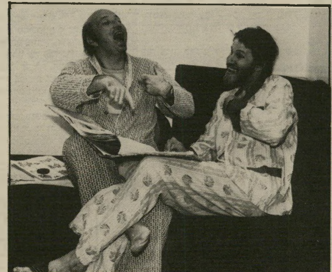
...אנו הראשונים שגילינו את הסקופ של "מעריב"

בכלל, מתפרץ השנון, והשם שלנו לא אמר כלום לאף אחד. למרות זאת הוא התפרסם בכל עיתוני יום שישי, וקיבלנו ב'