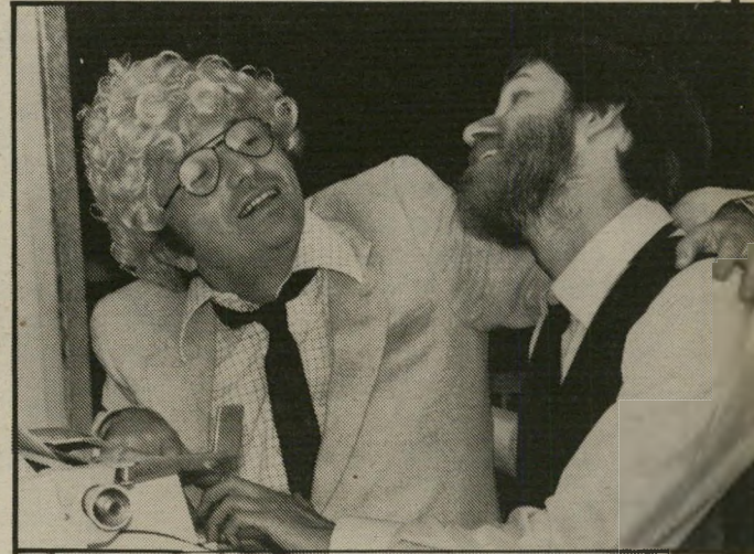
...ושניהם מביטים זה אל זה כווגייונים

המוני מובטלים, מפורטים וסתם משועממים בכל בירות העולם עזבו ביום החמישי שעבר את מנוחתם, ויצאו ל'