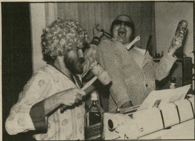
...הראש שלהם עובד במקביל על אותו טור

עיקבותיו המון תגובות. העצבני שביניהם שולף גזיר-עיתון מזיכב מארכיון מעלה-אבק, ומראה אותו בהתרגשות. נדמה לי שהוא פוזל עמוק לתוך המחשוף שלי. טוב שלי כשתי שחור. הוא קורא בקול: "שני צעירים חמים וחטרי' ניסיון (לא פנויים) בצעירות הטובות, אינטליגנטיות ואמי' דות שיוודעות לתת, למיסגשים סוערים בכל שעות היממה."