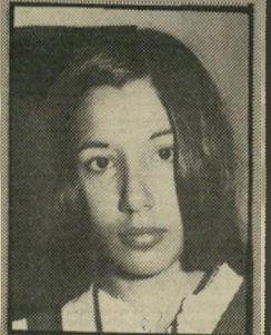
נתנאלה חם קר

ביום הרביעי שעבר התאספו קציני משטרה ושוטרים מהשורה עם רעותיהם בבוסתן-הזר תים באשקלון. ההתכנסות החגיגית היתה ב"סות החגיגית היתה ב"