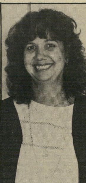
תובעת חן כאשה אל אשה

התובעת חקרה גם את סוּזי על משמעות המילים שבהן הציעה לאייש הודאה תמורת נישואין. "האם את כלי-כך פראיריות, כלי-כך לא שווה כלום, שאת צריכה לקחת על עצמך עונש של 10 שנים על דבר שלא עשית, כדי שהוא יתחתן איתך?" שאלה התובעת את הנאשמת, כדבר אשה אל