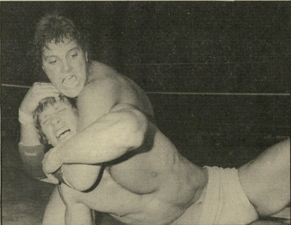
כריס אדמס וקווין ואן-אריק אלימות! כוח! גבריות! נצחון! דם!

הסעיף, תעסוקה בשעות-הפנאי של כל הוואן-אריקים: "ניקורים בכת-יחוד לים ומי-בצע-התרמות לילדים חולים." כשיצא קווין בפעם הראשונה לאכול בכיכר-נמיר, על שפתימה של תל-אביב, עטפו אותו המעריצים באהבה. רק במאמץ משותף הצליחו השומרים שלו, ביחד עם שוטרי מישמרה-גבול, מישרת מרחב-הירוקן ובלשי המרור המרכזי לשחררו מידי אוהביו, שנהרו לאחר מכן בהמוניהם להופעות בהיכל יד-אליהו.