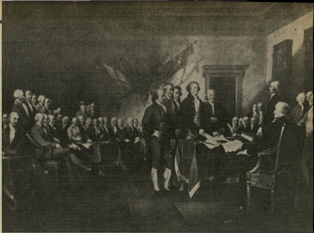
חתימת מגילת העצמאות של ארצות-הברית: החטא הקדמון נדחק

הענק האסיאתי תפס עתה את מקומו כמנהיג העולם. טוקיו היתה לכותרת הכלכלה העולמית. הגזעים הצבעוניים שוב אינם "נטל על גבו של