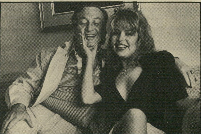
פיה זאדורה ומשולם ריקליס את מי היא אוהבת

ממחלקת-הריגול של צפון-אמריקה שלחו אליי את ההודעה המודיעינית הבאה: פיה זאדורה עומדת לקנות חלק בקבוצת הבייסבול, פורטלנד-בייבס. למרות העובדה שהיא מודה שאינה מבינה שום דבר בבייסבול, "אני רוצה להיות מעורבת בבייסבול", היא אמרה, "אני מתכוונת לראות כמה מישחקים השנה". זאדורה, שהקריירה שלה בתור זמרת מתקרמת הרבה מעבר לקריירה כשחקנית, תקנה עד 20 עד 37 אחוז מהקבוצה, יחד עם מנהל-העסקים שלה, טינו בארד . "אני אוהבת את טינו, ובייסבול זה אהבת חיים" אמרה הזמרת. ואנחנו כל הזמן חשבנו שהיא אוהבת את משולם ריקליס , וְשֶׁגִּפְלִיטְע פִּישׁ זֶה אַהֲבַת חַיִּיה.