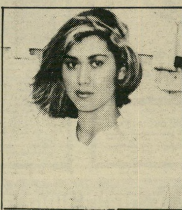
ברכה רובין מלכת-היופי - מחוץ לתחום

רק בשבוע שעבר ריווחתי לכם על הדברים האמיתיים שקורים בטלוויזיה הישראלית. איך כתבים מרביצים לנשותיהם, ואיך אפילו יש כתב צעיר ויפה אחד שחוטף מכות מאשתו. מיד עם פירסום הקטע הזה טילפנו אליי מהרדיו של צבא-הגנה לישראל, ושאלו אותי למה אני מפלה אותם לרעה. סיפרו לי שכבר שנים כולם יודעים שאחד האנשים הכי מוכשרים והכי פופולאריים בגלי צה"ל גם כן מרביץ לאשתו מכות הגונות, כששורה עליו הרוח. אז למה לקפח את הצבא? מה יש, לא מגיע להם?