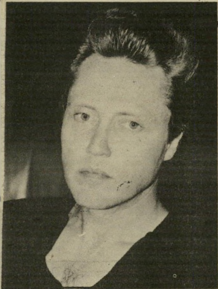
אורח כריסטופר ווקן

פרד וארד, בתפקיד השוטר שהופך לסוכן, הוא ברנש מגודל בעל כיעור סימפאטי, וילפורד ברימלי (אחד הזקנים בקוקון)