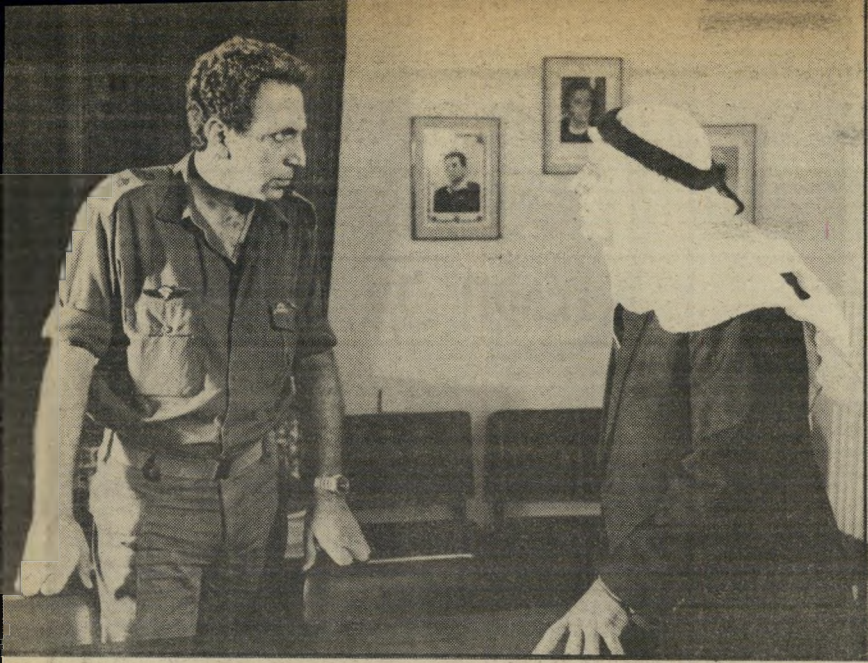
חזרי כסגן אלוף ב.חיוך הגדי" התפקיד הראשון שלי היה קצין מצרי באמי הגנרלית!"

רציתי בכל זאת לעשות משהו בערבית. ועשיתי הצגה בבית-הגפן עם בימאי רוסי. שלא ידע עברית. היתה הצגה נהדרת, אבל כל הזמן היינו רבים, זורקים כיסאות. קיבלתי מזה אולקוס. חשבתי כל הזמן ששום דבר לא מתקדם. ולמה חזרתי ארצה.