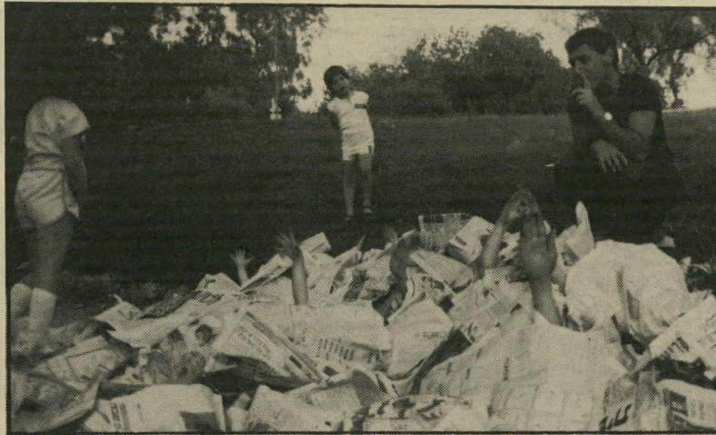
ילדים נולדים מערימת עיתונים, מישחק מס' 5

הערה: למכורים לתותים, אפשר להמיר את קליפת הלימון ומיץ הלימון במעט נזיל 300 גר' תותים מרוסקים, ואז הופך המעדן לפרפה תות.