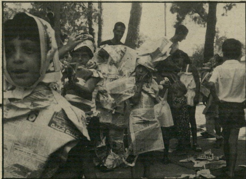
ילדות פולניות תופרות שמלות, מישחק מס' 7

אם הם לא ייהנו מהחומר הזה — אני טייר. איספו בשכונה או ריכשו כחנות צמיגי-אופניים (ישנים) רקים וקלי-משקל. נקו אותם וציבעו. או