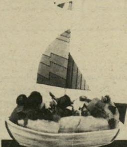
הרצליה פיתוח ככרדה שליט