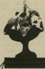
נתניה הרצל 3

גלידות בלון מיוצרות על בסיס פירות וחמרים טריים בידי אשפי גלידה שהובאו מחו"ל