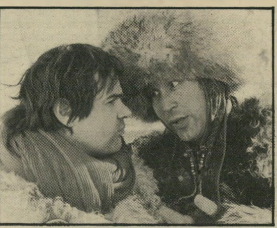
צבי צייס ודן אייקרוייד: שני פקקים

ושלווה. אם לא יתערבו במעשיהם כוחות השחור, במיקרה זה קברניטי הצבא, יתגברו בעצמם על הכל, אפילו על תופעות שנבצרו מבינתם. גם המדענים, כמו במיפגשים המוזכר בזה אינם המיפלצות מהד"ר סטריינג'לב, כי אם דומים יותר לטרימו (בסרט הנ"ל), ואם אפילו מתגנב ללב קורטוב של אימה בגין תיזכורת פרנקשטיין ויציר-כפיו, הרי בארט אוליבר החמוד והמהימן נבחר דווקא משום שכל-כך קל לאהוב אותו.