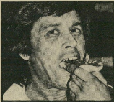
ראשי־מערכת מרגלית סנדוויצ'ים לצוות

הל לכטל את ביטול המיכרו ולפתוח אותו מחדש. אחרים מחברי־הוועד הכריזו כוונתו הכרות חד־משמעיות נגד מינויו של צמח לתפקיד.