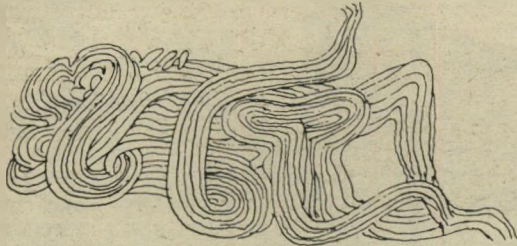
ציור ארוטיו של ולאדי

אחריכך דיברנו קצת על ישראל ועל אמריקה הלטינית. בעיקר על ניקראגואה. וולאדי תומך, כמוכן, במישטר הסאני דיניסטי, כמו כל האמנים והסופרים באמריקה הלטינית. הוא מותח עליו ביקורת, אבל הוא תומך בו. אין הוא מבין את מעשיה של ממשלת ישראל. המחמשת את הקונטראס, סוכני ארצות