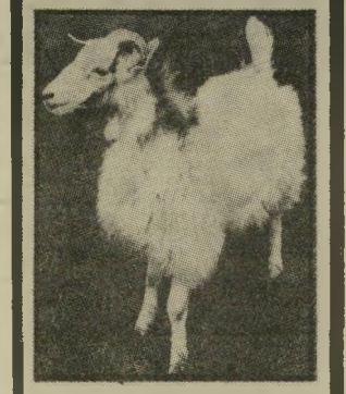
טלה עם ראש: פסול לשרות ציבור