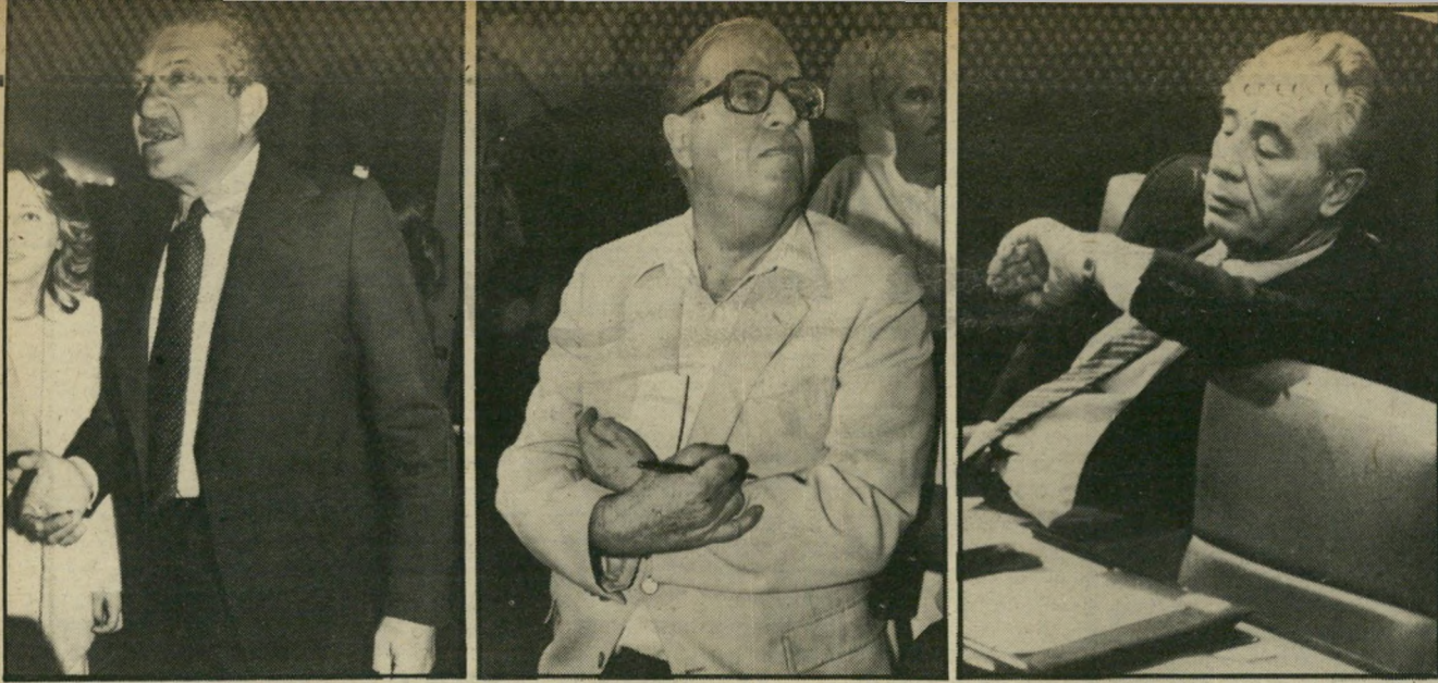
שימעון פרס כשר-בלי-חוק, אבא אבן כשר-החוק, עזר וייצמן עלול לפרוש

אולם תרגילים כאלה עלולים להפוך את היסדיהתיכון לגיהנום של טרור, ולמוקד של תהורהרות. האר-טלקים הבינו זאת, ומתחו ביקורת גלר יח על רגן, לישראלים לא היה איכפת.