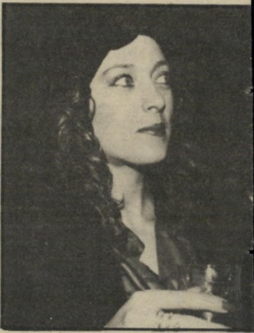
ואחרי הניתוח — לפני שלושים שנה