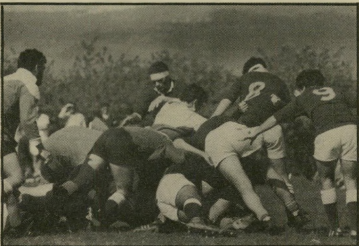
שחקני הראגבי בסעולה ביורעאל

כמה וכמה בחורים מצויינים עושים כהנה וכהנה מעשים טובים