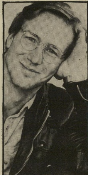
שחקן הרט (1986) אני שחקן אופי

ושהיה הסיבה למסיבה באותו ראיון בר-מול שערכתי עימו בפסטיבל-קאן האחרון, הוא זה של מולינה, מעצב חלונות-ראווה, הומוסקסואל, כסירטו של הקטור באבנקו נשיקה אשת העכביש (שהוצג פעם אחת בפסטיבל חיפה בישראל). הסרט יחנך בעוד שבועות מעטים את אחד מבתי הקולנוע החדשים של סירטי שפירי בלב דיזגוף, בתלאיבי.