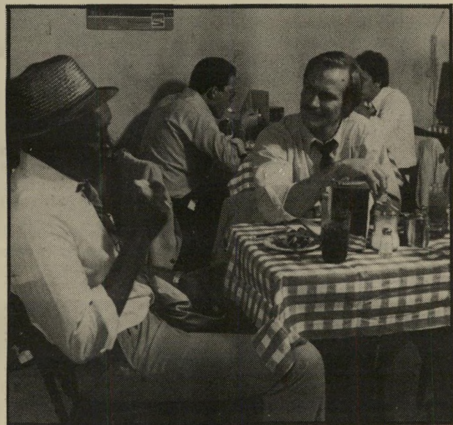
בעורדיין רוצח ב"בחום הגוף" לזרוק עצמי לתוך החלל"

עלילה על פי סיפורו של מנואל פואינג הארגנטיני, מפגישה את מולינה, שנעצר בעבירות-מוסר, עם מולינה (יה) מהפכן אנטי-פאשיסטי, תנא צגום של כלא בארץ דרום אמריקאית בלתי-מונה. מולינה, מספר-סיפורים פאנט-אסטי החי על זכרונות קולנועיים ארוי-טיים, טווה סביב חברו לבלא — המ-נוגד לו בכל אופיו, נטיותיו, אמונותיו ורעיונותיו — רשת של היות, שעה שהוא בעצמו נופל ברשת הקסם האישי של ואלנטיין. בסופו של דבר הוא הופך משום אהבתו הגדולה לחברו, מעכ-כרוש הצד לו נערים בחשכת-הילה, לאדם בעל כבוד עצמי.