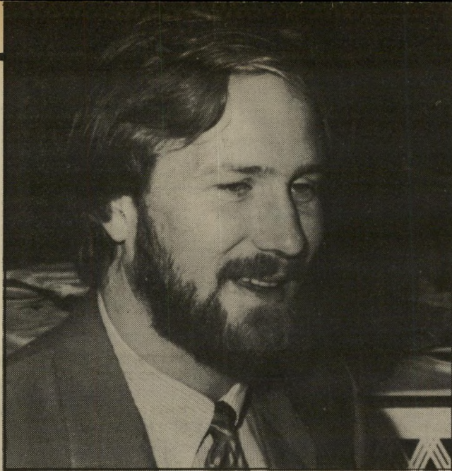
מרוויין ויליאם הרט (קאן, 1985) "אינני סמל מיני"

"בכל יצור אנושי יש שתי זהויות מיניות, ועליך להיות מספיק גדול כדי להבין זאת. אין זה אמר שאני הומר סכסואל, אבל יש בתוכי נשיות ויש בתוכי עדינות, ואיני פוחד מזה. זה רק מגדיל את האפשרויות הטמונות כי. וזו גם גדולתו של מולינה: הוא מגלה כי הוא מקדיש את עצמו לאדם אחד, ולא רודף עוד אחרי נערים ברחוב. זה הרגע הגדול שלו, הרגע שבו הוא וואלנטיין מתקרבים זה אל זה כליכך עד שהם מחליפים זהויות. אני אוהב את זה!"