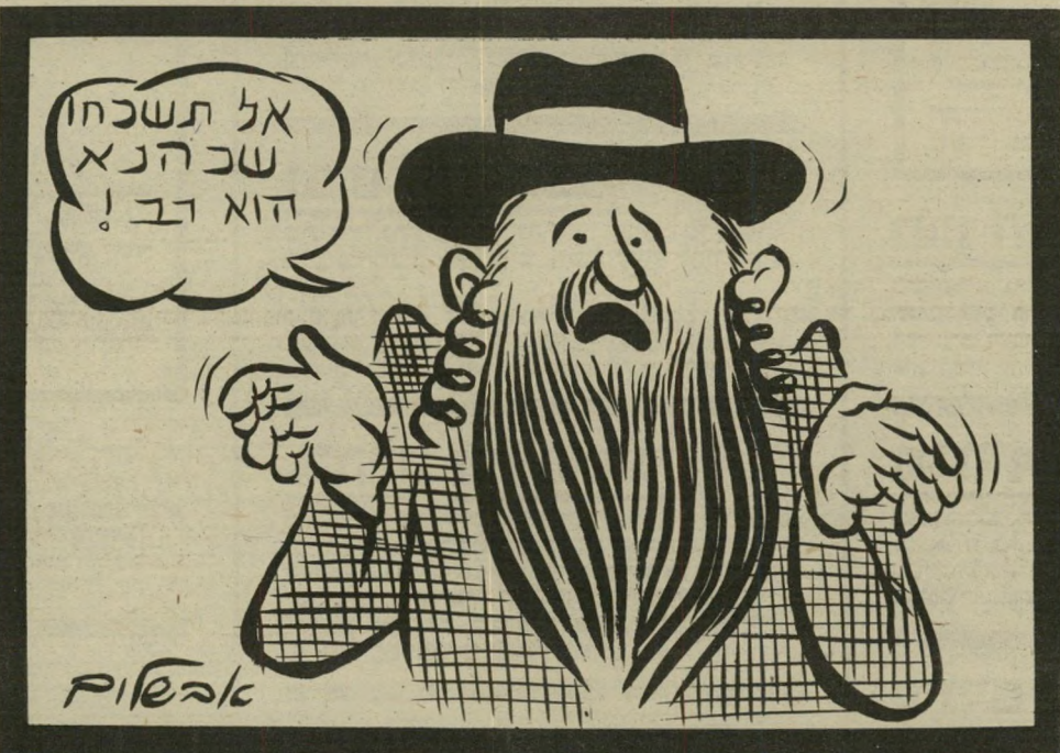
החוק נגד הגיזענות

הנשיא הפסיד אותה. מתנגדיו וכו כרוב של עשרה קולות. היתה זאת מכה מוחצת, ואולי קטלנית, לנשיא. המזור בכל הפרשה הוא שכל מא-כקה-האיתנים הזה, שבמרכזו עמדו יהודי ארצות-הברית, לא עורר שום התרגשות בישראל. הישראלי המצוי כלל לא שם לב אליו. אולם בארצות-הברית מאמינים רבים שישראל פועלת מאחורי הקלעים כשליחת ארצות-הברית, מחמשת ומדריכה את ההקונ' טראס" וממלאה את כל התפקידים אשר הקונגרס האמריקאי אוסר על הנשיא לבצעם. ומכיוון שהחלטה החדשה של הקונגרס ממיכה לקשור את ידי הנשיא, עשוי הנשיא להטיל תפקידים נוספים על ישראל.