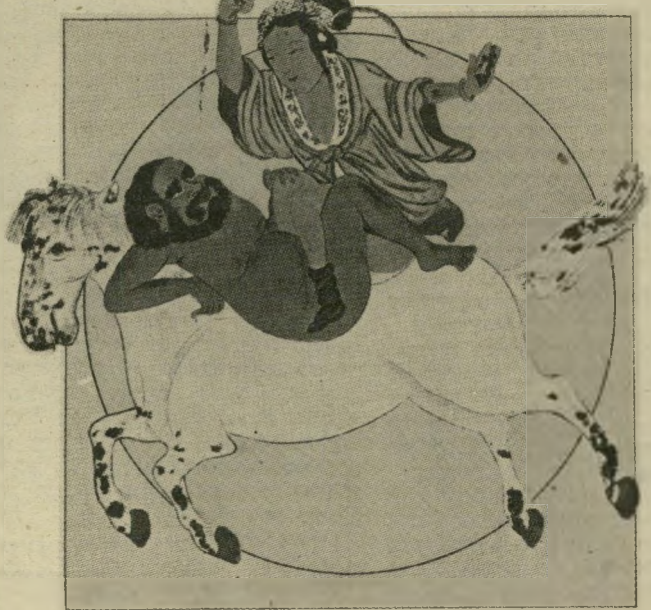
ככה ייעשה לאיש אשר המלך חפץ ביקרו

(כהלה גדולה באורווה, כשנודע כי ברגע האחרון החליף אברהם שפירא