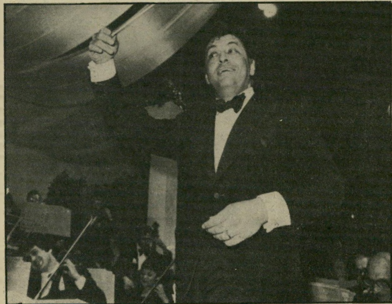
מנצח מהטה בסעולה להסיר את החרם