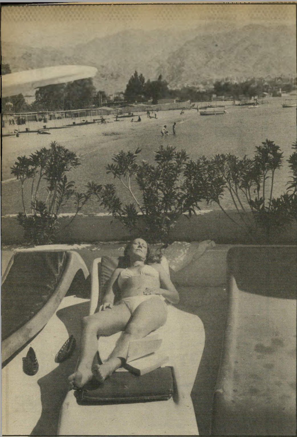
ליד בריכת המלון אקוה-מארינה. ברקע נראית העיר עקבה וההדים הסוגרים עליה ממזרח. זהו החוף הצפוני של המיפרץ. המוקדש לבתי-המלון לתיירים.

ומיתקנים לספורט-המים. עליתי לחדר רי בקומה הרביעית, התקלחתי באופן יסודי מאוד (הייתי מכוסה באבק של פטרה), ושכבתי קצת לנוח. הפעלתי את מקלטי-הטלוויזיה, וזכיתי בהפתעה.