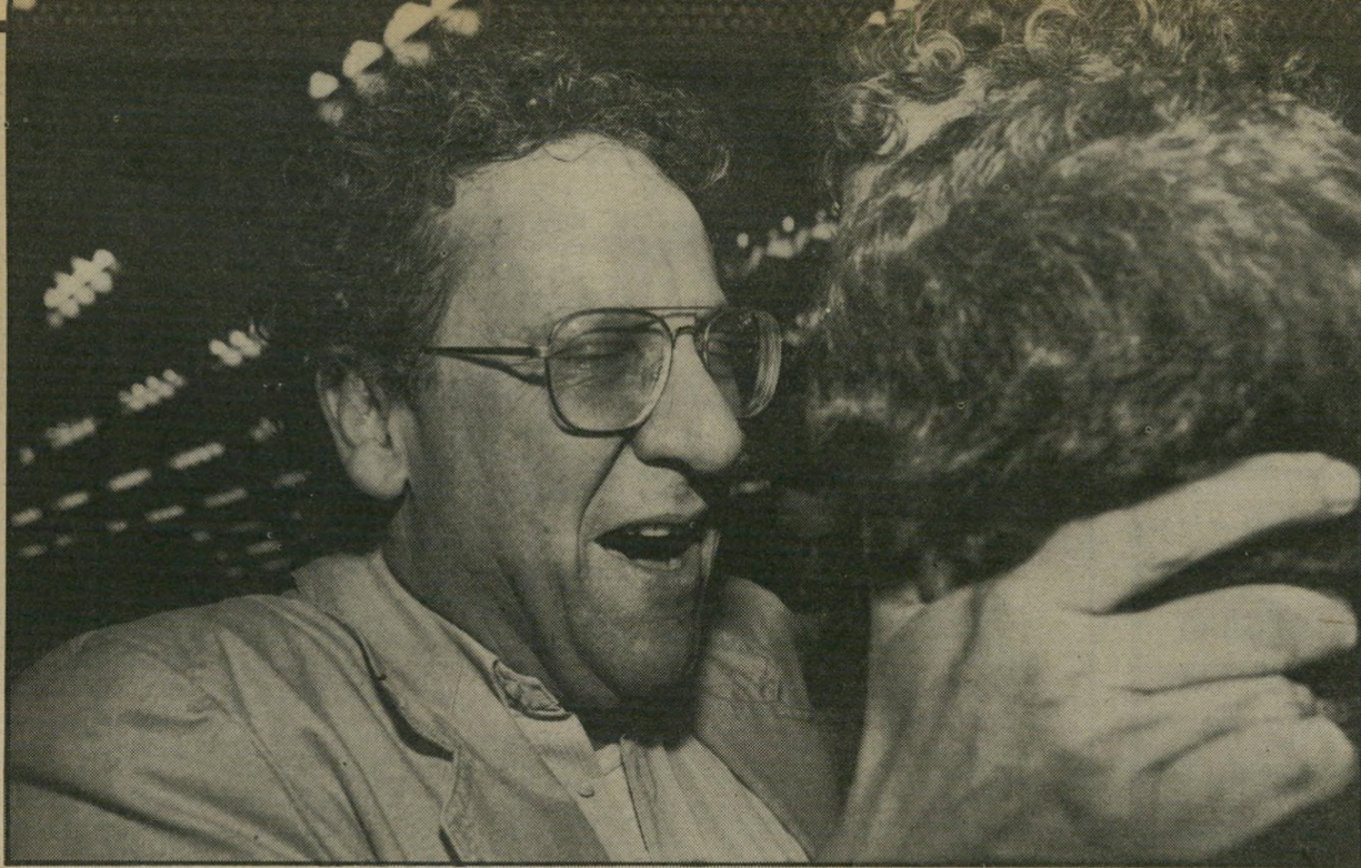
ריבלין בבחירות הפאנל במרכז חרות (1984) אל תשימו לב להשמעות... אפילו אם אסטה מהנורמות המקובלות עליי...

אישיות בסניפים, וחיזרו אחרי כל קול. במרכז זכה ריבלין במקום טוב לקראת סוף רשימת הפאנל. הוא היה מאושר, ואת מניו הציפו דמועות-שימחה כשנודע לו על בחירתו. הוא הרגיש אז שזכה בגלל עבודתו הקשה והמסורה בתנועה, ובגלל כישוריו ואישיותו. לכנסת הוא לא זכה להיבחר, משום שלא נכלל בשלוש השביעיות הראשונות. אך היה ברור שהוא בדרך הנכונה, וכי לא רחוק היום והוא עוד יגיע לשם ויקבל, בזכות, את מושבו כח"כ מטעם הליכוד.