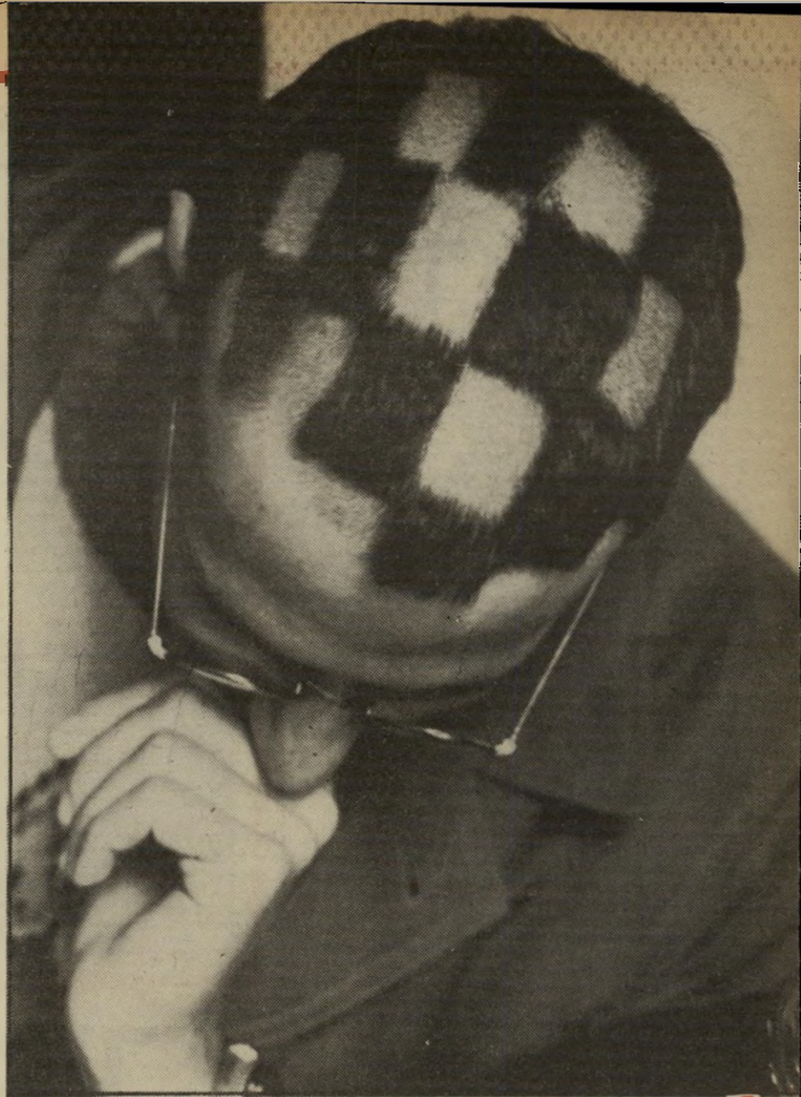
לוח שחמית מבקשים מחבר טוב לגלח את השיער ריבועים ריבועים ולבושים בגדים בגווני שחור ולבן. אם מתחרטים. אפשר להשלים התיספורת לקרחת. ולהתחפש לאסיר בורח.