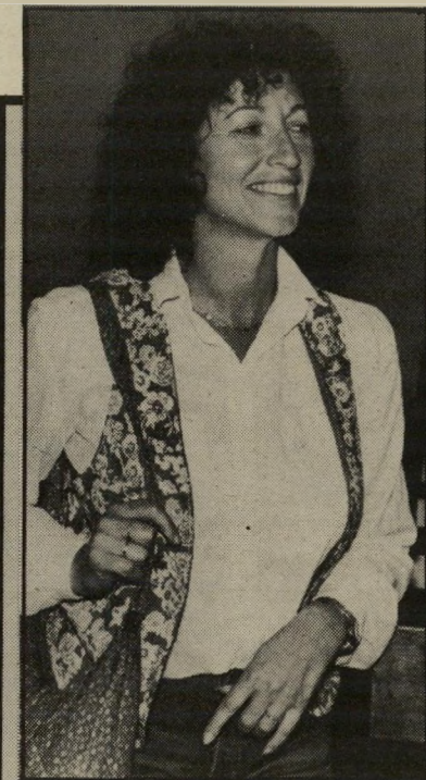
בתבת רו גם הבעל