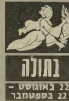
22 באוגוסט - 22 בספטמבר

בתקופה זו אתם מושכים את בני המין השני ומתחילים בקשרים חדשים. אבל למעשה זו לא התקופה שבה אפשר לפתח קשרים רציניים ויצויבים. אם פשר תתייחסו בקלילות או לפחות הקפידו שלא ל-הראות מה אתם מרגי-שים. ב-14 וב-15 בחודש אתם עשויים ליהנות מכגישה מיוחדת בנסי-בות די מזרות. אבל זה מה שישר את מצב-הרוח. טיפול במכשירים ביתיים דורש זהירות מירבית. יש לכם נטיה להיפגע.