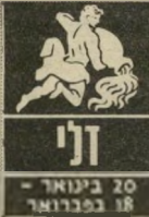
20 בינואר - 18 בפברואר

התחום הכספי גורם לדאגות, אתם מסובכים ומסתבכים בגלל אי-הבנות אל תמהרו לתת אמן באני-שים שמעמידים מני-ידידים. למעשה, מצב-כם לא מעורר דאגה, אבל עד סוף החודש תתכוננו להמשך העב-יות רק מפני שאינכם דואגים להסביר את עצמכם לאנשים הנכו-נים. בקרוב מאוד תהיה לכם אפשרות לשנות את מקום העבודה, כדאי לחשוב על כך ברצינות. אתם זקוקים לשינוי, לא לשיגרה.