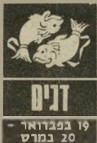
19 במרס - 20 במרס

אתם מתחילים להרגיש יותר טוב, אבל רק מהבחינה הפיסית. מלבד זאת אתם חשבים ה-מבולבלים. התחום ה-כספי דורש טיפול זהיר. בתקופה זו אתם יכולים לבצע כמה טעויות ש-יעלו ביוקר אל תעשו משהו ששתי רגליו עומדות על הקרקע. הי-מים השישי והשבת יהיו נעימים. בעיקר אם תכ-נותם טיול ביקור או פגישות עם אנשים שתברתם נעימה לכם. מה-16 עד ה-18 בחודש יהיו ימים קשים.