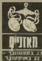
21 בספטמבר - 22 באוקטובר

ה-12 וה-13 בחודש יהיו מוקדשים בעיקר לתחום הרומנטי. אבל קשה כרגע לשמור על הרגשות בצורה מאוזנת - חיי האהבה די רעוי, עים, כצמוי בתקופה כזאת. אדם שהיה קרוב ינסה ליצור שוב קשר ויהיה די קשה להחליט איך לנהוג. תוכלו ליהנות מהפגישות רק אם תדעו שזוהי הנאה לזמן קצר, בסוף החודש יתחולל מיפנה חשוב. קשרים עם ארצות אחרות עלולים לגרום לאכזבה. ביחוד בין ה-16 ל-18 בחודש.