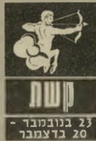
23 בנובמבר - 22 בדצמבר

התקופה אינה קלה, מה שקורה סביבכם די מבלבל ומדאיג. אתם לא בנויים להיגררות אחרי האירועים. בדרך כלל אתם שולטים ב-מצב, אבל כרגע הכל השתנה. ענייני מגורים מטרידים ומרגיזים, ב-עבודה לא ברור מה רוצים מכם ומה אתם בעצם רוצים לעשות. הימנעו מלריב ולהת-יוכח, הטוב ביותר בש-בילכם הוא לתכנן ב-שקט את העתיד ולהתכונן לשינויים בתחום העבודה. כל תוכנית חייבת להישמר בסוד.