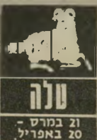
21 במרס - 20 באפריל

אומנם מצב-הרוח עדיין לא קל והמתחיות עוד לא חלפה. אך השבוע תרגישו בהקלה. אתם מקבלים תמיכה ועידוד מאנשים שעי-מם יש לכם מוגע, ודווי-קא מגישה מיקריות ומכרים מיקריים עוז-רים להעלות את המורל בתקופה זו. בהחלט לא רצוי לבטוח באנשים עדי כדי לדבר בחופ-שיות על דברים שהש-טיקה יפה להם. יש לכם נטיה לתת אמן ולשתף בבעיותיכם אנשים שאינכם מכירים - זה עלול לגרום לבעיות.