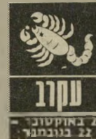
22 באוקטובר - 22 בנובמבר

במקום שבו אתם עובדים כדאי להסתייג מאותם המגלים ידידות וחביבות. אלה משום מה מסכנים אתכם. גם אם אינם מתכוונים ל-כך, חיי הרגש שלכם מתחילים להשתנות. סביבכם חברה חדשה ולא-טלאת יוצא לכם להכיר אנשים מסוג חדש. כדאי לנצל את ה-תקופה, לצאת לביילויים ולהיזכר בתחביבים ש-היו כלי-כך חשובים ב-עבר. כדאי לשקול ללמוד ולעסוק בהם ברצינות. במשך הזמן להפוך זאת למיקצוע.