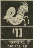
21 בדצמבר - 19 בינואר

ב-12 וב-13 תהיו די מבולבלים, אתם עלולים לשכוח את המפתחות או לאבד חפצים חשובים. יתכן שאתם נתונים להתלבטויות, חושבים על נסיעה, או חושבים על מתגש עם האינ-טרסים שלכם בעבודה. אבל טוב לתכנן נסיעה, אבל לא לפני חודש אפריל. במקום העבודה אתם עומדים לפני קידום, וני-סיעה לא יכולה להזיק. ידיים אינם מועלים לטובתכם. כרגע אי-אפשר לעשות כלום. לפחות לא לשתף אותם בדברים החשובים.