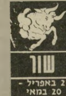
21 באפריל - 20 במאי

אתם חשים די מאוכזבים ובודדים. ידידים שמהם ציפיתם לעזרה מתחמקים ברגע שאתם באמת זקוקים להם. אתם מאבדים את הסבלנות ומתלבטים ב-קשר לעתיד. מתעורר ה-צורך לשנות את העוב-דה או להתחיל בעיסוק חדש. כרגע אינכם מוצאים ואינכם יודעים מה מתאים לכם. זה גם לא הזמן לביצוע שינוי-יים. כדאי להמשיך ב-שיגרה ובבוא הזמן תדעו מה הכיוון שאליו תפנו. בתחום הרומנטי אתם די מבולבלים.