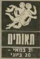
21 במאי - 20 ביוני

במקום שבו אתם עובדים מתחילים קצת להירגע, המתחיות יורדת, אבל הבלבול גובר. האנשים סביבכם אינם יודעים מה הם רוצים, וזה עלול להביא אתכם לביצוע לא נכון של העבודה. לפני כל החלטה חשובה כדאי להתיעץ עם הבוס, אל תקחו על עצמכם אחר-יות. בשישי ובשבת כדאי לנוח ולאגור כו-חות לקראת ה-16 עד ה-18 בחודש. שנראים די קשים ומעצבנים. ידידות חדשה עומדת להתחיל בקרוב.