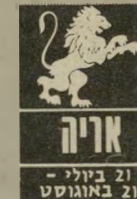
21 בקילי - 21 באוגוסט

ענייני כספים מעסיקים אתכם כעת - למעשה המחשבות נמצאות במקום אחר, אבל משום מה מטילים עליכם אחריות לכספים של אחרים. ב-12 או ב-13 בחודש תקבלו ידי-עה משמחת או מיכתב מחו"ל. אבל אל תמהרו להתלהב ממה שיוודע לכם. זה עלול עוד להש-תנות כמה פעמים. לי-מודים או עבודה מע-סיקים את רוב זמנכם. זה לא קל משום שאינכם מרגישים די חזקים. מחלות ישנות שבות להציק לכם.