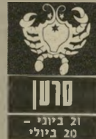
21 ביוני - 20 ביולי

לבעיות המתעוררות מדי יום בעבודה קשה למצוא פיתרון. אתם מרגישים שכל האחריות נופלת עליכם ואין מי שאפשר לחלק עימו את העומס. יותר מכל מתחשק לכם ל-ארוז ולצאת לנסיעה קצרה. זה לא יפתור דבר. תוכלו לתכנן את נסיעתכם הקרובה, אך חודש מרס אינו מתאים לכך. ענייני בריאות מע-סיקים אתכם. עליכם לטפל באדם חולה, ולטפל גם בעצמכם. בשישי ושבתי מומלץ לצאת לביקור ידידים.