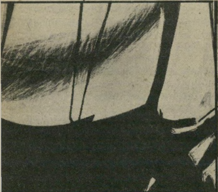
אהרון מסג: "נוף", רישום גרפי

כשמסג בוחר מוטיבים "הדורשים" כשלעצמם את ההתממשות בצבע והפוכם לשדות, לשירבוטים שחורים מלווים בחרי-טות... בהכרח הוא קשור לתפיסה מסויימת האוהבת את האמבלמאטי והמאגני... הוא עוסק במאגיה (אולי שחורה)... דומה שהחריטות השונות משמשות לגילוי הרבדים