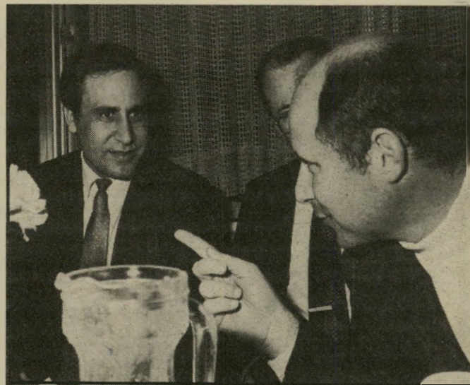
מאשים איתן (עם הישר קצב) זאת היא הצגה

ב־5 בינואר 1986, כאשר אמצעי התיקשורת שרויים בתרדמה עמוקה ובקשר של שתיקה והשתקה, הזוהר ח"כ איתן על הקמת הוועדה החשאית, שדיוניה ועצם קיומה מוסתרים מעיני הציבור. ועם חבריה נמנה אחד מבכירי חברת העובדים, שסולל בונה משתייך אליה. התיקשורת שתקה. הצניעו את דיברי ח"כ איתן, אם בכלל התייחסו אליהם. איתן לא הירפה. הוא התלונן