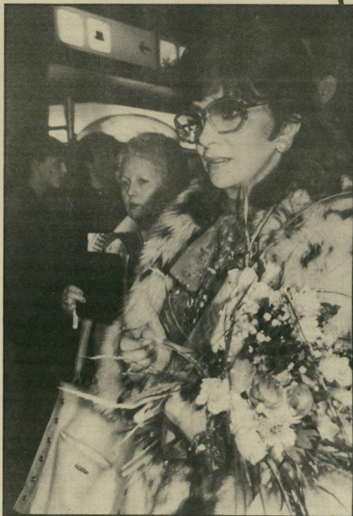
נשיאת חבריהשופטים לולוברדיג'ידה חיפוש אחר כלברועים גרמני

כחו במקום לא הוזמנו בגלל הישראי לים או בגלל הירוקים. הפעם גנבו הי גרמנים את ההצגה כולה, בגלל תסי בן-יאשמה בן זמננו: היה זה סירטו של ריינהארד האוף, שטאמהיים. שהעי