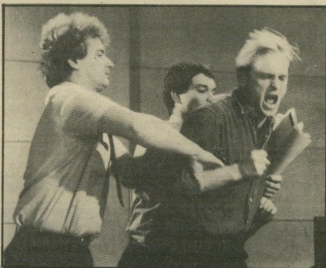
אולריך טוקור בתפקיד אנדריאס באדר הסרט חשוב, כי הגרמנים לא ידעו

האמת היא שאיש לא טרח להמשיך ולשאול לרעתה של הגברת, שהיתה עסוקה ביותר בחיפוש אחרי כלבירוי עים גרמני שביקשה לרכוש בגרמניה, עסוקה מכדי שתואיל ללמוד בעל-פה כמה שמות של הווכים בפרסים. הגברת היפה-עדיין עלתה על הבימה בכרכיים רועדות, ולא הצליחה לומר מבלי לגמ"גם גם את שמו האיטלקי של הבימאי (המשך בעמוד 36)