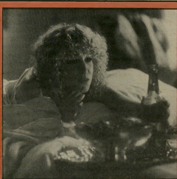
בנ מורדוקח לתקוף ולגנוב

נשמע בהמועדון ביום החמישי האחרון, מפי מלצרית צעירה, מאוכזבת: כל הטיפים שלי רוקדים עכשיו בליקוויד."