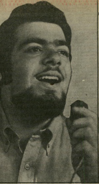
גינת: זמר ורזה