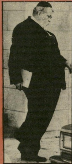
ח"כ שפירא בשבוע הבא

לפני כשנה פורסם ב"העולם הזה" כי ח"כ גדלי-המימדים — אברהם שפירא — עושה דיאטת-הרזיה. שפירא רא סיפר אז בלשנו הצעירות ובהתלהבות רבתה, כי השיל כבר 15 קילוגרמים ממישקלו המפורסם, ועוד הכרס נטויה. מאמצים בכיוון זה אכן נעשו ומגשים עמוסים דיאטה ל-עייפה — הרבה דיאטה! — נישאו לעבר חדרה של ועדת הכספים, ששפירא מכהן ב-ראשה. יש הגורסים, כי שפירא אכן הפחית ממימדיו מההתלהבות הכללית. על כל פנים, במימדים שכאלה קשה לדייק. השבוע החליט שפירא להרחיק לכת ולנקוט בצעד דראסטי. הוא החל בטיפול בבית-החולים הדסה. טיפול האמור להניב תוצאות מהפכניות תוך שבוע ימים. חכו שבוע ותראו.