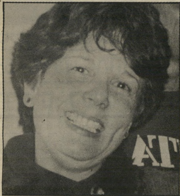
ריקי טוניק שני אנשים עצובים

עוד בטרם נרגעו הרוחות במהילה המישפטית בארץ, הם נפרדו. אבל דן צימרמן לא חזר עוד הביתה ולא למישרד שלו. היום יש לו מישרד קטן משל עצמו, ופה ושם רואים אותו עם חתיכה זמנית על היד. זה סיפור אחד. הסיפור השני הוא על אל"מ ירמי אולמרט, אחד מאחיו של הח"כ, והוא סיפור לא כליכך נעים. ירמי אולמרט נפצע. כשפינו אותו והביאו אותו לבית-החולים, נשארה אשתו ואם שלוש בנותיו לבד בבית, והיא היתה צריכה להיעזר בנהג של בעלה כדי להגיע לבית-החולים כל יום ולבקר אותו. כל יום היתה האשה נוסעת עם הנהג, וכל יום הוא מצא חן בעיניה יותר ויותר. כשחזר ירמי הביתה אמרה לו אשתו שהיא שמחה מאוד שהוא יצא מהפציעה שלו. חוץ מזה היא אמרה